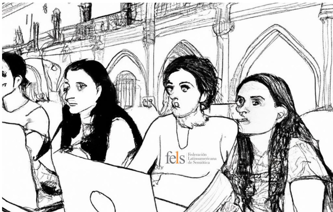
La Federación Latinoamericana de Semiótica reúne a los investigadores de semiótica en América Latina.